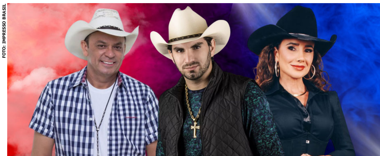
Estância Turística de Salesópolis estreia o 1º Natal Luz com grandes shows e gastronomia local