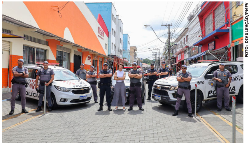
As ações ocorrerão por todo o município, reforçando o policiamento na região central e pontos estratégicos proporcionando segurança a todos os cidadãos

Com a proximidade das festividades de fim de ano, a Prefeitura de Ferraz de Vasconcelos, em parceria com a Secretaria de Segurança, intensificou o policiamento nas ruas da cidade por meio da operação "Natal Seguro". O objetivo é garantir maior tranquilidade e segurança aos moradores, visitantes e comerciantes durante este período.