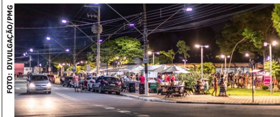
Turistas apreciam a gastronomia na feira noturna que fomenta a economia na cidade

Outras informações sobre o evento podem ser esclarecidas pelo telefone (11) 4693-1432.