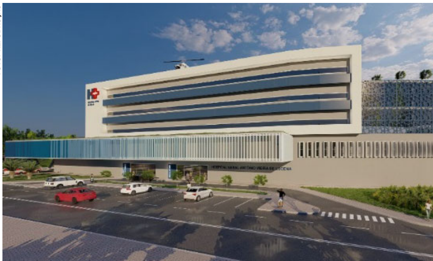
Hospital promete revolucionar o atendimento em saúde no Alto Tietê

cidade e contará com uma estrutura completa com: unidade de Pronto-Socorro; Centros cirúrgicos; Unidade de Terapia Intensiva – UTI; Serviços de apoio e diagnóstico de imagem e Análises Clínicas Ambulatoriais; Ambulatório de Especialidades para atendimentos de