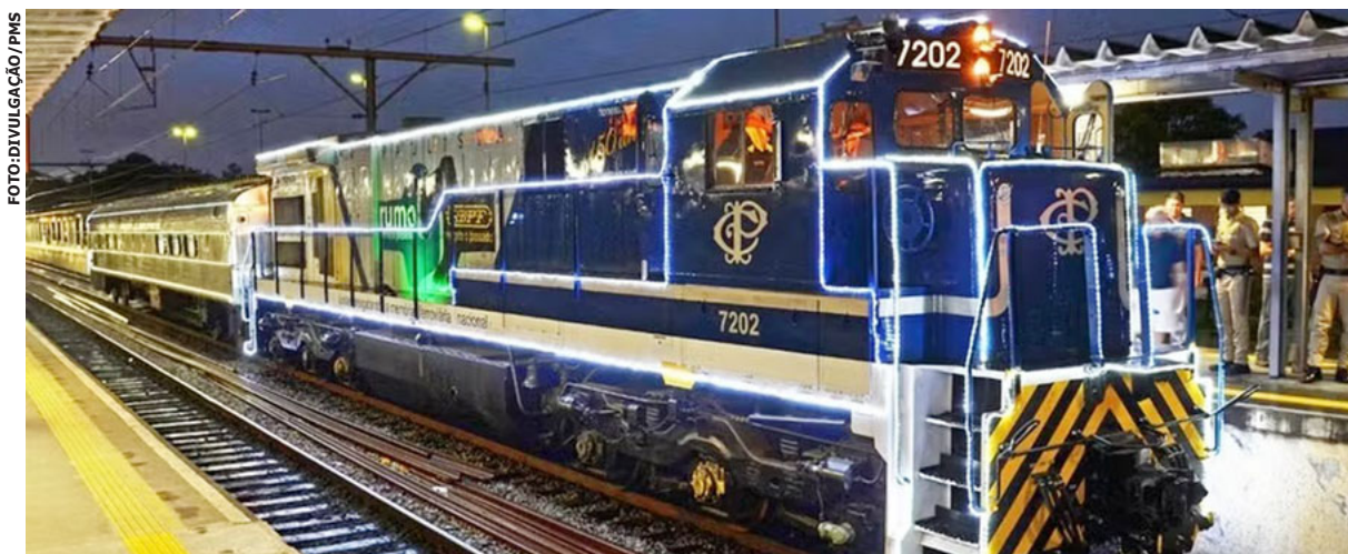
Na cidade de Suzano, o Trem Iluminado e a Parada Natalina prometem emocionar o público

13 de dezembro: Feira da Mulher Empreendedora de Natal, das 13h às 23h.