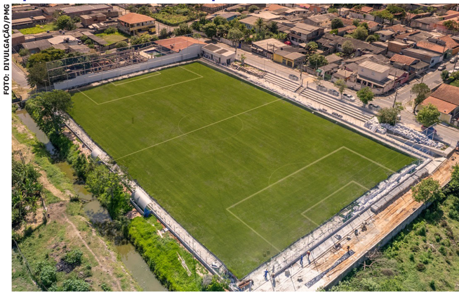
Obras duraram seis meses com o melhor da infraestrutura no Parateí, que incluem grama sintética e iluminação para o local ser usado à noite

Para inaugurar o novo estádio, estes jogadores que formam a Seleção das Estrelas vão disputar uma partida contra o time de Guararema, haverá momento para os fãs tirarem fotos e pedirem autógrafos também.