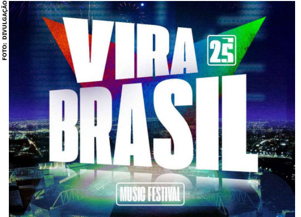
Especial gospel trará uma transmissão inédita com palavras de fé, esperança e muita música