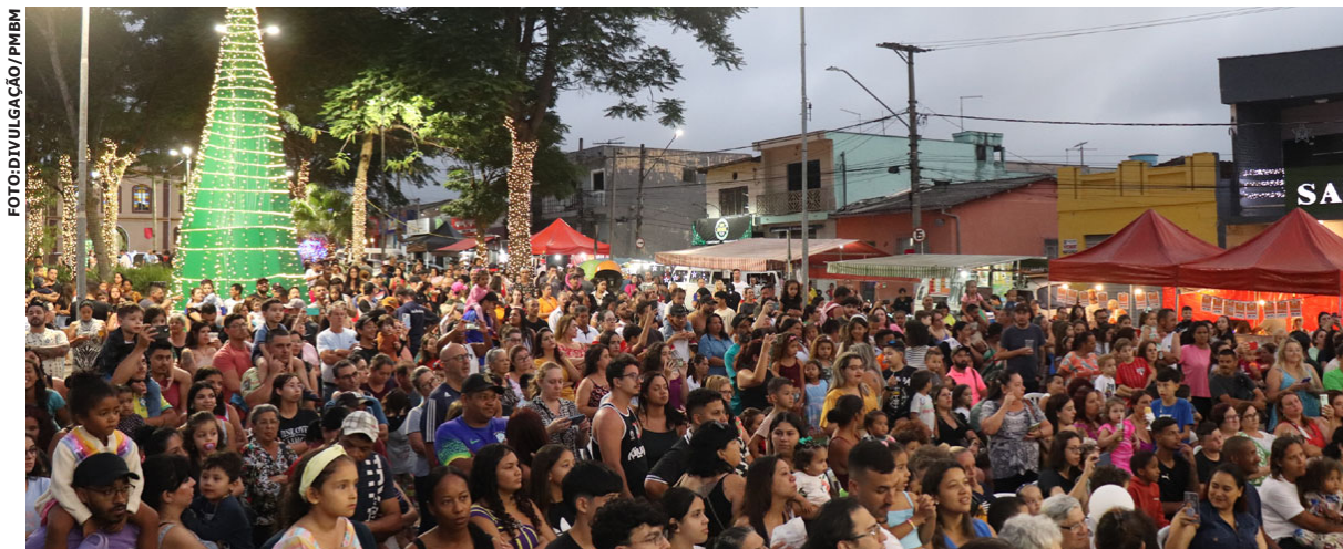
Biritiba Mirim celebra a magia natalina com eventos culturais e feiras para toda a família