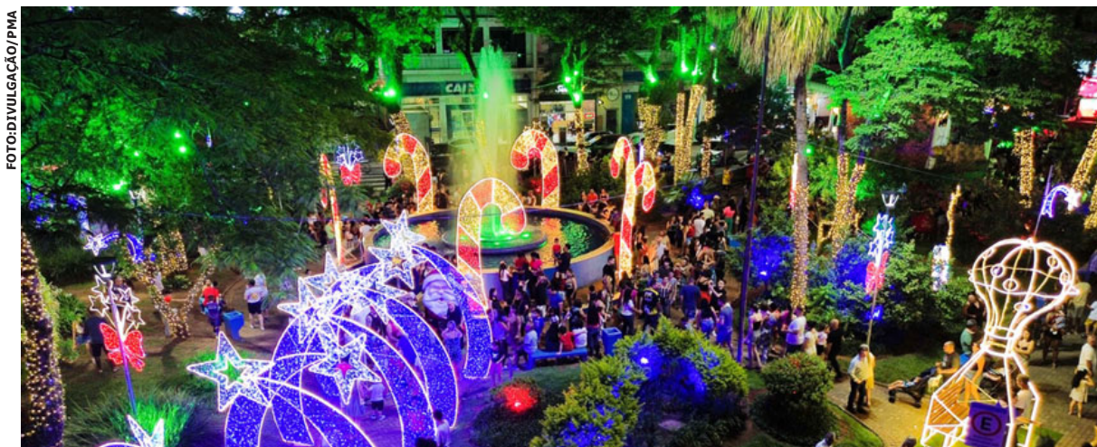
O Natal Encantado de Arujá ilumina a cidade com atrações especiais e diversão garantida

12 de dezembro: Feira Noturna de Natal, das 18h às 23h.