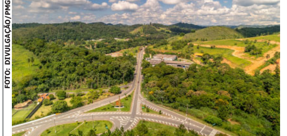
Transição de áreas rurais para urbanas com foco em sustentabilidade será debatida

A população poderá sugerir áreas para inclusão ou preservação. O projeto segue o Plano Diretor, com prazo de 10 anos para ocupação das áreas. Outras informações: (11) 4693-8000.