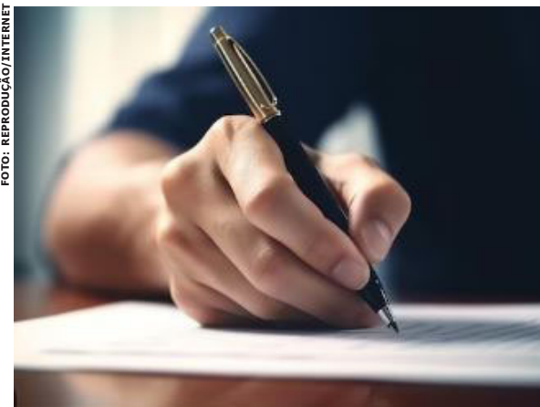
Com o auxílio das canetas, os políticos do Brasil determinam leis que podem ou não beneficiar o povo

O poder da caneta é tão gigantesco, seja em esfera pública ou privada, que, dependendo da ótica, se assemelha a um pincel mágico por aquilo que pode provocar ou transformar, principalmente quando atinge a vida de outros indivíduos ou de uma coletividade. Nunca é demais lembrar a célebre frase: "Quer conhecer um indivíduo, dê poder a ele", escreveu o conceituado delegado federal Victor Poubel, no dia 2 de agosto de 2017, em sua coluna no Jornal Extra. E esse assunto está tão atual que pode ser comentado em rodas de conversas porque o que os Poderes Executivo, Legislativo e Judiciário determinam por meio da importância da caneta que afeta todos os brasileiros e também os habitantes do Alto Tietê,