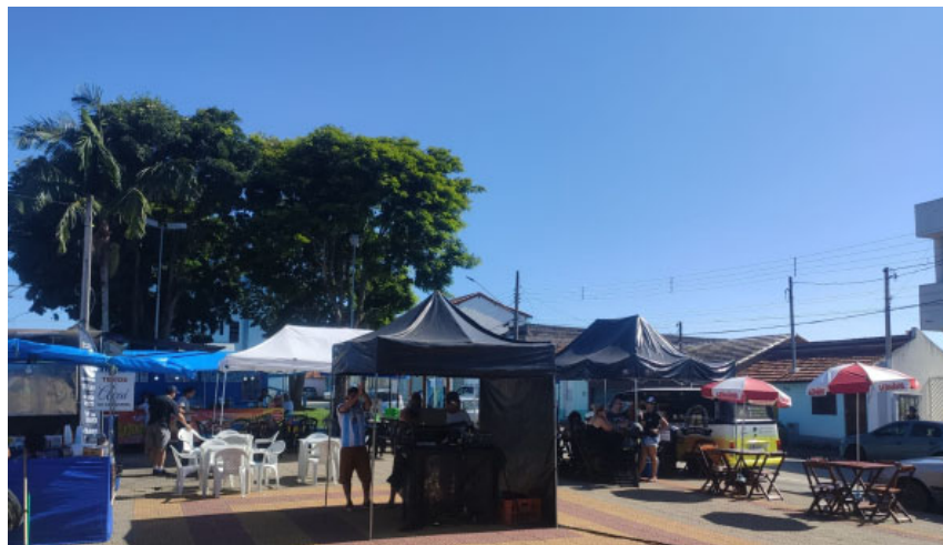
Expectativa da Prefeitura Municipal de Salesópolis é atrair cerca de mil pessoas à Praça Antônio Souza Prado, no Distrito Nossa Senhora do Remédio

Com o intuito de valorizar as Bandas de Rock da Estância Turística de Salesópolis, a prefeitura municipal, comandada pelo prefeito Vanderlon Oliveira Gomes (PL), instituiu o Festival de Rock da cidade que está em sua segunda edição. Neste sábado, dia 30 de novembro, acontecerá o evento no Distrito Nossa Senhora do Remédio, na Praça Antônio Souza Prado, com entrada gratuita.