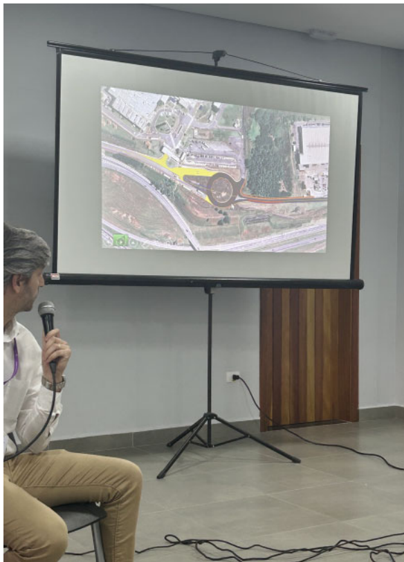
Com a conclusão do projeto executivo, obras da alça de acesso devem começar em até seis meses

Novo acesso trará 7,2 km de pista marginal, rotatórias e viadutos para melhorar a logística do local