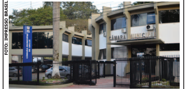
Câmara de Arujá irá receber a 1ª audiência de revisão das legislações urbanísticas dia 6