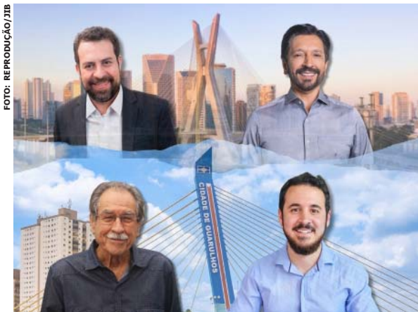
As eleições de outubro revelam a polarização entre direita e esquerda nas duas maiores cidades do estado