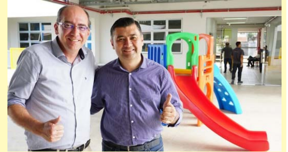
Prefeito Rodrigo Ashiuchi junto do secretário de Educação, Leandro Bassini

Em Suzano, a Educação segue avançando! Em sete anos de gestão Rodrigo Ashiuchi (PL), foram entregues 23 novas unidades educacionais, incluindo 15 creches comunitárias e 8 escolas municipais. Essa expansão beneficia mais de 28 mil alunos, proporcionando acesso a uma educação de qualidade, tecnologia avançada e infraestrutura de alto nível.