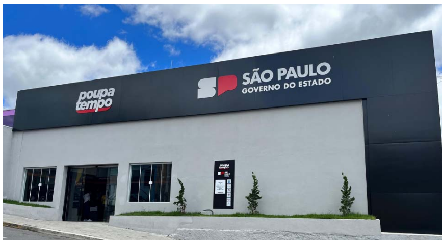
Na sede do Poupatempo de Biritiba Mirim, que fica na Rua Gildo Sevalli, nº 371, no Centro, os mantimentos e roupas poderão ser doados

A Secretaria Municipal de Saúde de Biritiba Mirim e a agência do Poupatempo oferecem pontos de coleta para que os mantimentos e roupas possam ser encaminhados aos afetados pelas cheias no Rio Grande do Sul.