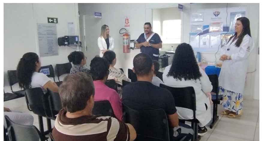
Equipe da Prefeitura Municipal de Santa Isabel orienta os pacientes a não faltarem nas consultas, porque essa prática atrapalha o setor

Os números preocupam e fazem com que a Prefeitura de Santa Isabel tente reduzir o absenteísmo. No mês de abril, 3.352 consultas agendadas na rede municipal de Saúde foram perdidas por não comparecimento do paciente. Nas 12 unidades de saúde, foram realizadas 14.669 consultas ou procedimentos médicos e odontológicos. Em contrapartida, 3.352 pessoas não compareceram ao posto de saúde no dia