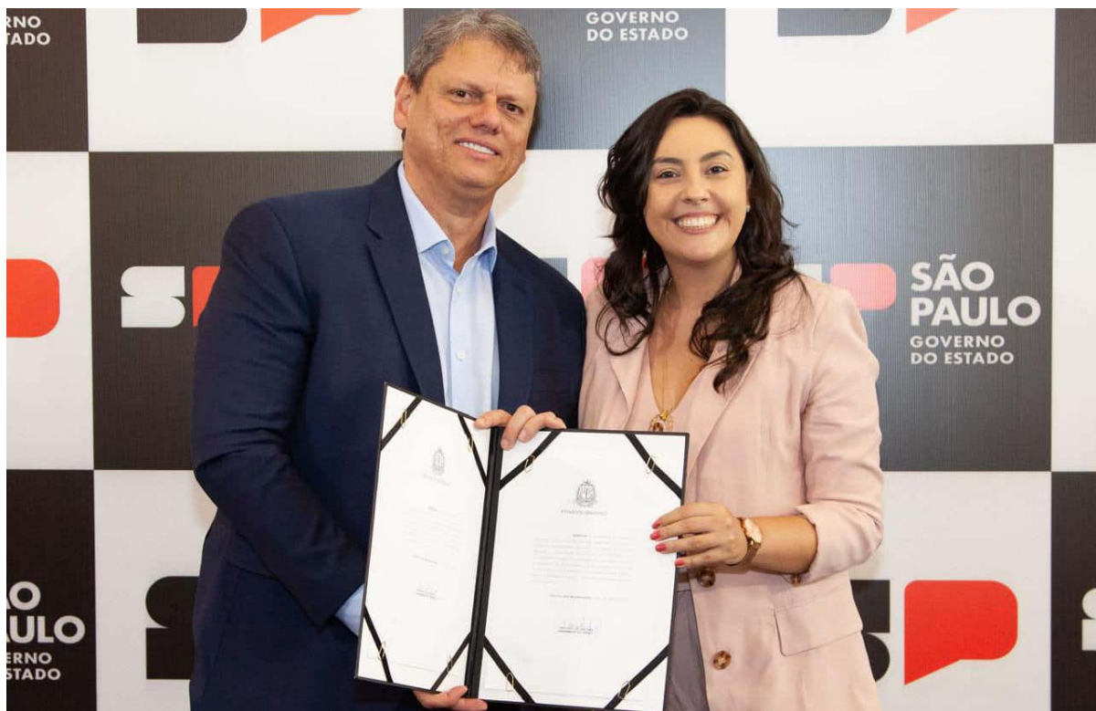
Cerimônia foi realizada no Palácio dos Bandeirantes e nela foram destinados mais de R$ 533 milhões para ações de infraestrutura e saúde de municípios. Ferraz foi contemplada

Prefeita conquistou recursos que serão aplicados em obras estruturantes no município de Ferraz